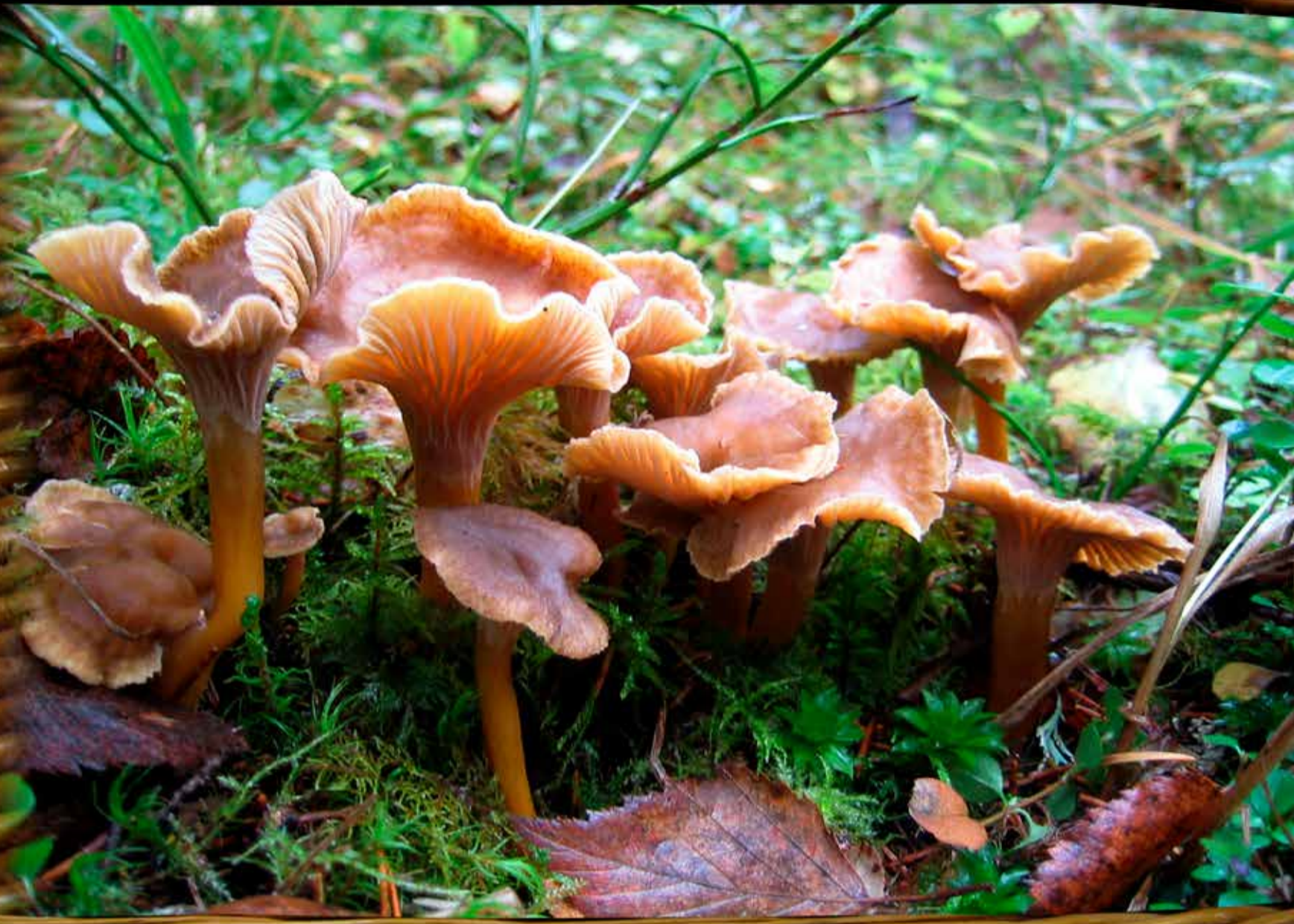
SUPPILOVAHVERO ( Cantharellus tubaeformis ) ****

Tasainen lehtiverho peittää jo lehdot ja sekametsät, mutta onneksi loppusyksyn valtalaji, suppilovahvero, viihtyykin parhaiten sammaleisissa tuoreissa kuusimetsissä. Se kätkeytyy taidokkaasti metsän aluskasvillisuuden sekaan ilman lehtipeittoakin. Suppilovahvero on kuin sienikunnan karpalo: ensin ei tahdo löytyä mitään, mutta kun kumarrut, se palkitsee sinut runsain mitoin vielä syysmyöhälläkin!